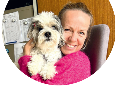
Eleses Arbeitsbeitrag: Sie stellt dem Team Kuscheleinheiten zur Verfügung.

Auf das Team der Kindersozialdienste St. Martin sind wir stolz! Denn gute Arbeit kann nur mit guten Leuten geleistet werden.