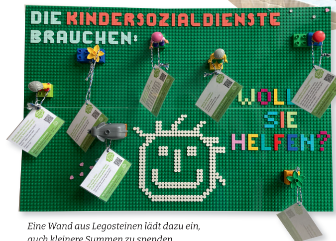
Eine Wand aus Legosteinen lädt dazu ein, auch kleinere Summen zu spenden.